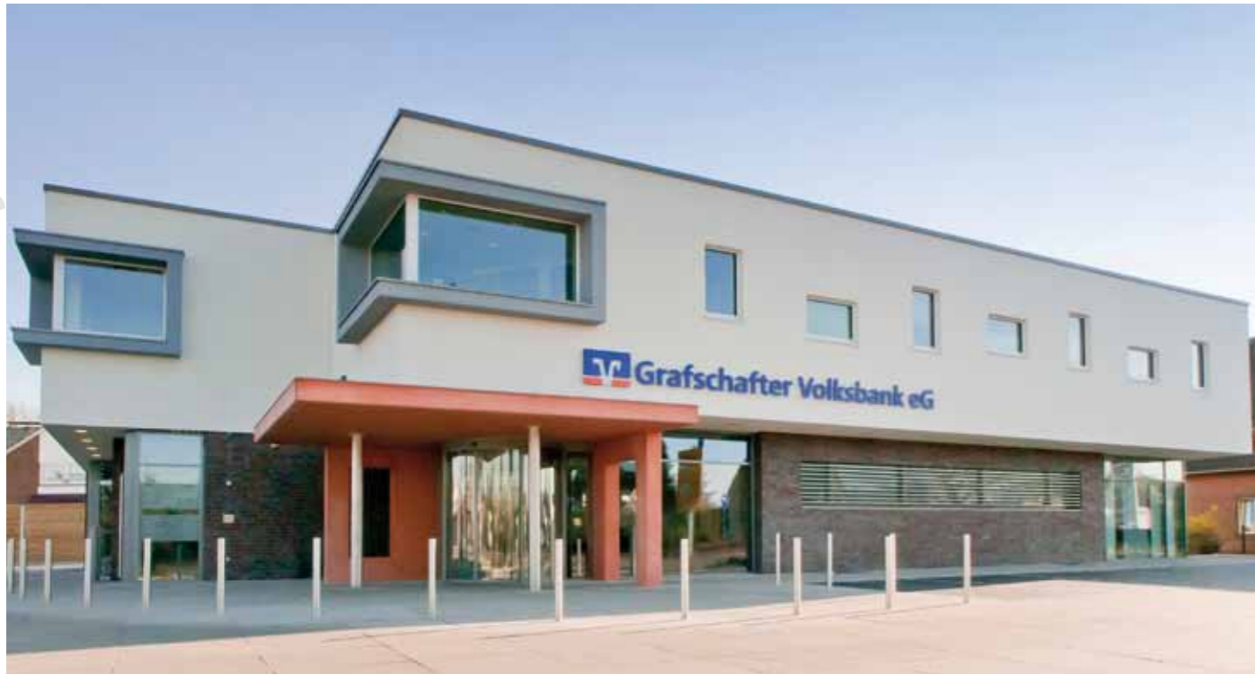
▲ Das moderne Gebäude hat neben der Volksbank auch eine Praxis für Allgemeinmedizin, einen Friseursalon und eine Kosmetikpraxis als Mieter.

Mit dem Neubau an der Wasserstraße trägt die Grafschafter Volksbank der Entwicklung der nordöstlichen Stadtteile Nordhorns Rechnung. Die Bank erwarb das Grundstück im Herbst 2008 und bezog die Haushalte der betroffenen Ortsteile aktiv mit in die Planung ein. Vor dem Bau der neuen Geschäftsstelle wurde eine Einwohnerbefragung durchgeführt, um zum einen die Erwartungen an den Kundendienst der Bank zu erfragen und um zum anderen zu erfahren, welche Wünsche es seitens der Kunden für die weitere Vermietung des Komplexes gibt. Nach Abriss des ehemaligen Kamps-Gebäudes im Spätherbst 2009 begann der Bau der neuen Geschäftsstelle mit der Grundsteinlegung Anfang April 2010.