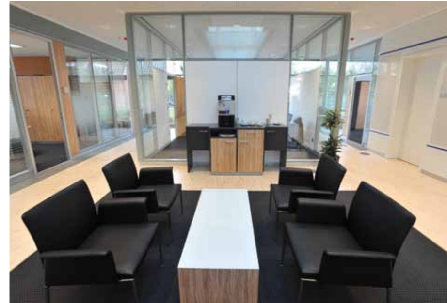
▲ Eventuell entstehende Wartezeiten verkürzen sich die Kunden im Loungebereich mit Info-TV und Kaffee.