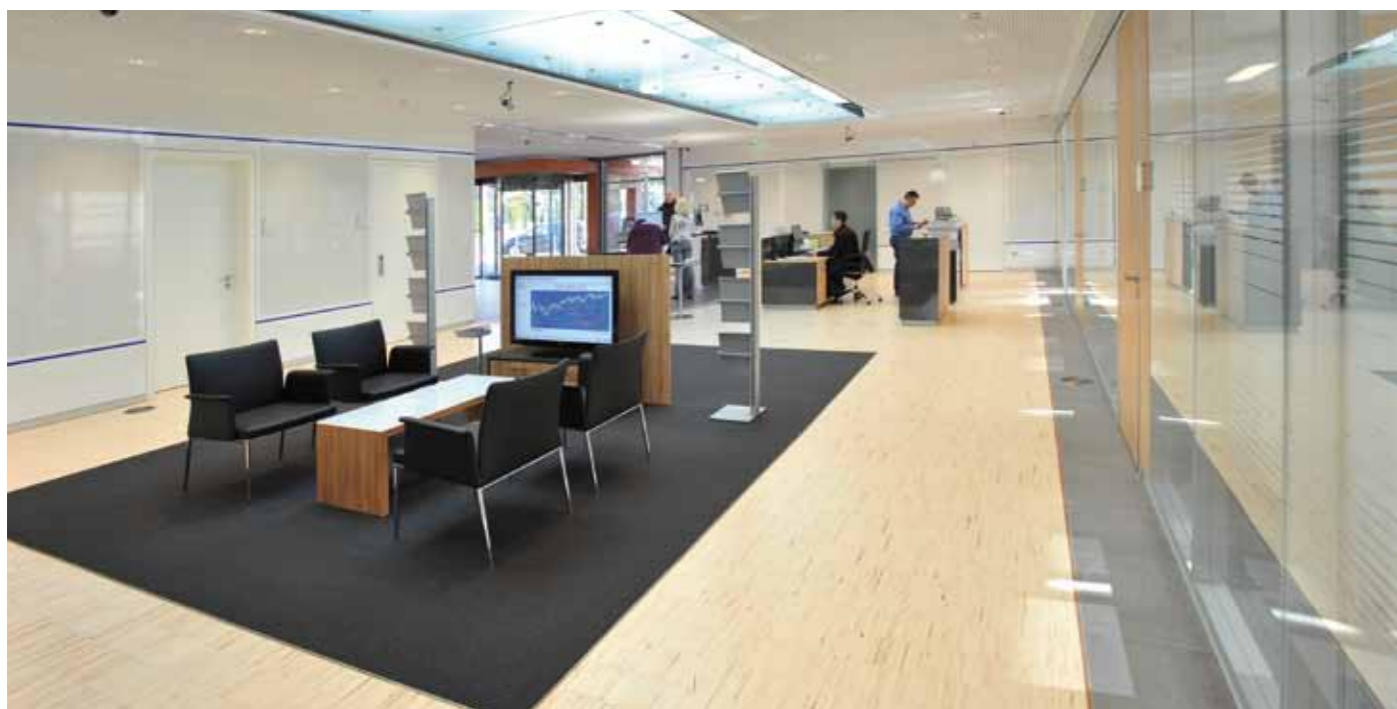
▲ Hell und freundlich ist die Atmosphäre durch das lange Lichtband im Deckenbereich.

Nach knapp siebenmonatiger Bauzeit wurde die Geschäftsstelle an der Wasserstraße im Oktober 2010 fertig gestellt. Am 15. Oktober zog das Team der ehemaligen Geschäftsstelle Lingener Straße in die neuen Räume um. In dem modernen Gebäudekomplex siedelten sich weiterhin ein Allgemeinmediziner, eine Kosmetikpraxis und ein Friseursalon an.