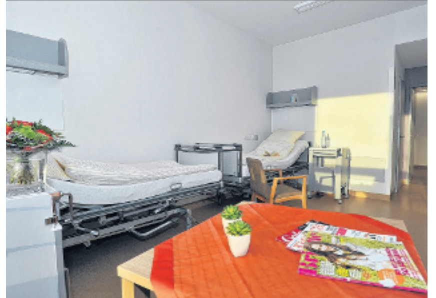
Hell und modern ausgestattet sind die neuen Zimmer für die Patienten.