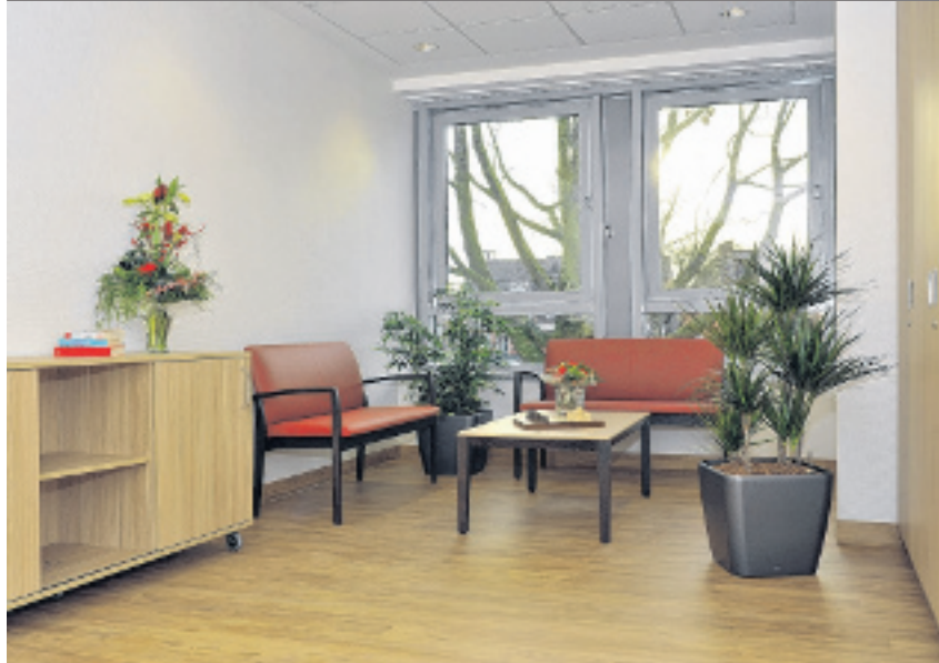
Gemütliche Sitzcken sind in dem Neubau entstanden.